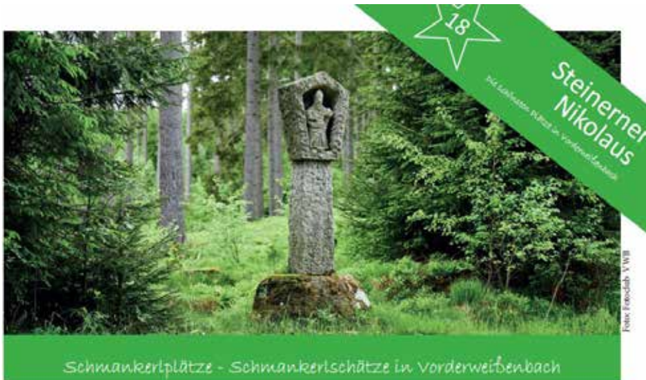
Schmankerlplätze - Schmankerlschätze in Vorderweißbach